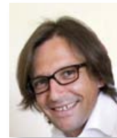
Par Sébastien Klémencic

Le prix Atout Soleil, opération de mécénat développée par GPMA, avec le soutien de GENERALI, distingue chaque année depuis 6 ans des associations dont l'action quotidienne combine conviction, ingéniosité et efficacité au service d'un thème donné.