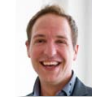
Par Romain Bricout

ISO 26000 est l'unique norme internationale qui vise à fournir aux organisations les lignes directrices de la responsabilité sociétale.